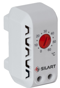
TBS-160 NC, 0 ... +60