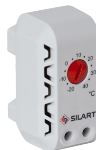
TBS-140 NC, -20 ... +40

Рекомендуемые термостаты для управления данным устройством